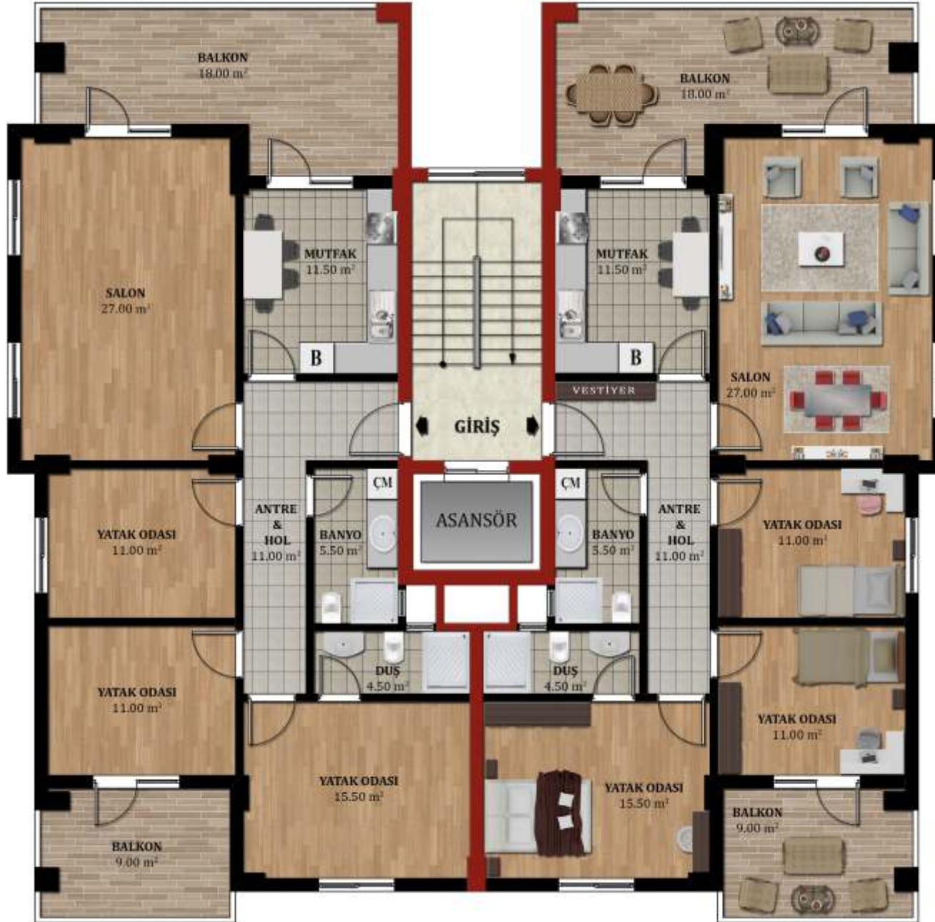
NORMAL KAT PLANI