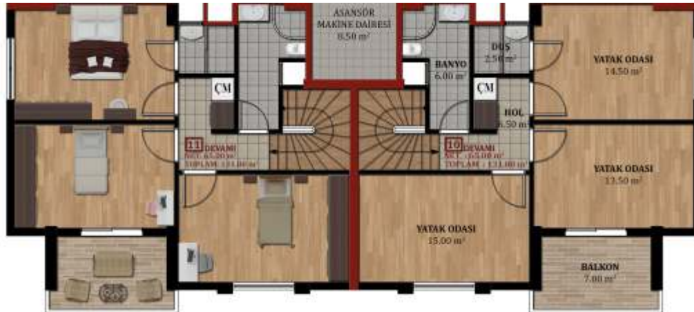
ARKA DUBLEKS ÜST KAT