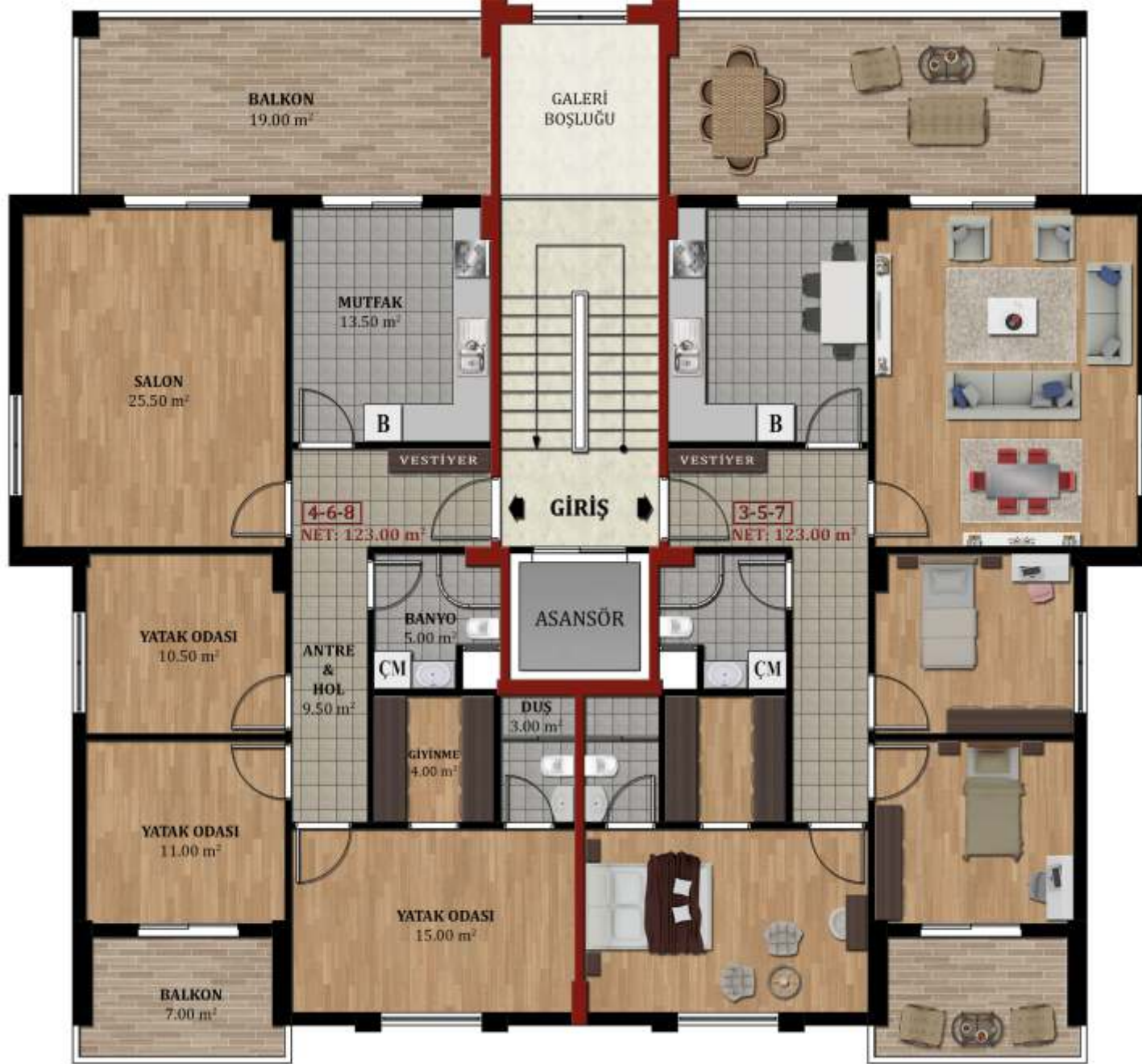
NORMAL KAT PLANI