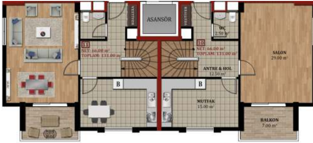
ARKA DUBLEKS ALT KAT