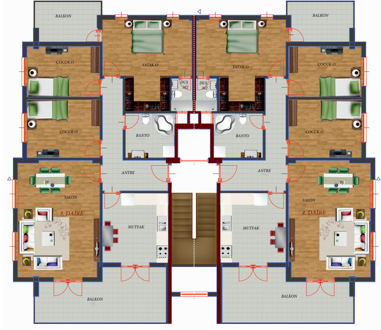
NORMAL KAT PLANI